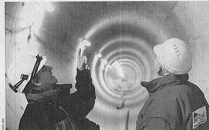
Akár a fővárosi négyes metró építkezésének leállítását is hozhatja egy esetleges kedvezőtlen brüsszeli döntés

A három százalékos hiánycél megszégése egyáltalán nem ve-